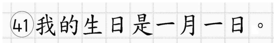
Рис.14. Образец написания иероглифических знаков

иероглифический знак и каждый знак препинания следует писать внутри отдельной клетки области ответов бланка ответов № 2 (дополнительного бланка ответов № 2) (рис. 14).